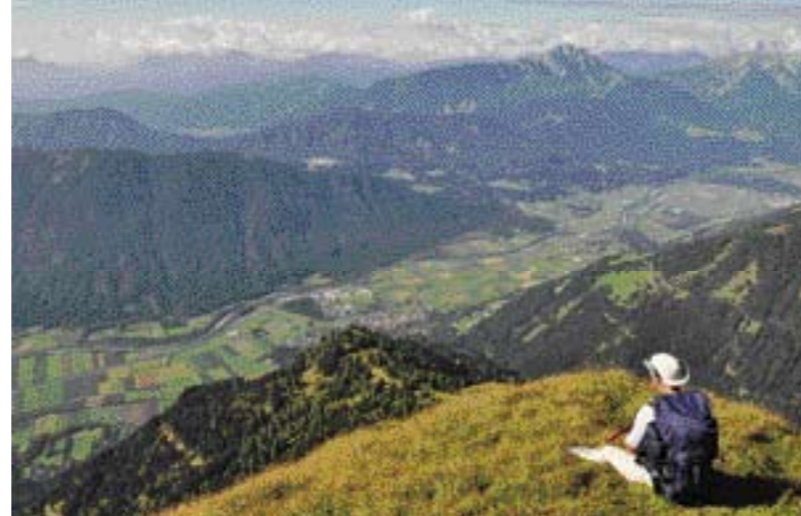
Von der Frosch- zur Vogelperspektive: Hoch über der Drau.