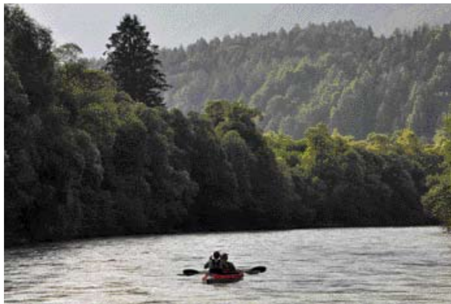
Welcome to the jungle: Wo Osttirol auf Kärnten trifft, läuft die Drau zur Höchstform auf.

delt man im Wanderkajak durchs Oberdrautal: schnell und kurzweilig genug, um nach jeder Biegung neue Perspektiven zu genießen, und gleichzeitig so beschaulich, dass man auch als unerfahrener Kanute nicht im Strudel der Angst versinkt. Die Etappenlängen sind frei wählbar, die möglichen Kombinationen zahlreich. Sportlich Ambitionierte bolzen die Drau in Marathonmanier an einem langen Tag hinunter, Genießer dehnen die Tour auf ein verlängertes Wochenende aus. Überall in den kleinen Dörfern am Ufer gibt es Restaurants und Cafés, ruhige Zeltplätze und gemütliche Pensionen – genug Gelegenheiten für süße Pausen, für Rast und Erholung. Für eine Auszeit im nimmermüden Alltag. Vorbei an Greifenburg, Steinfeld und Kleblach-Lind geht die Fahrt Richtung Spittal, bis der Fluss hinter einer Talenge bei Sachsenburg – und am Ende schneller als gewünscht – das Oberdrautal verlässt. Die Landschaft weitet