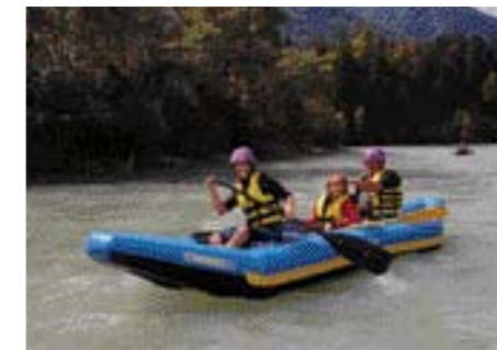
Einsteiger befahren die Drau im kentersicheren Schlauchkanadier.

Lässt man heute in Lienz sein Wanderkajak auf Wasser, merkt man von Kraftwerksregulierungen und Hochwasserdämmen erst mal nichts. Stattdessen erfasst einen die Magie des Flusses, besonders im Sommer, wenn die »kleine« Drau vom Gletscherwasser der Isel bis an den Rand gefüllt ist. Dann geht es im Eiltempo durch leichtes und spritziges Wildwasser, vorbei an zauberhaften Alpenkulissen: zuerst vor den schroffen Steilwänden der