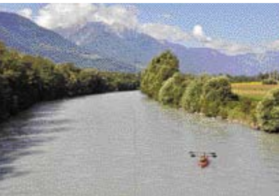
Hohe Berge bieten der Drau eine würdige Kulisse.

Bis 2011 sollen 15 Kilometer Fluss wieder in den Urzustand versetzt werden. Kostenpunkt zehn Millionen Euro. Elf Kilometer sind schon fertig. Und auch die Reststrecke der Oberen Drau lohnt jeden Paddelschlag.